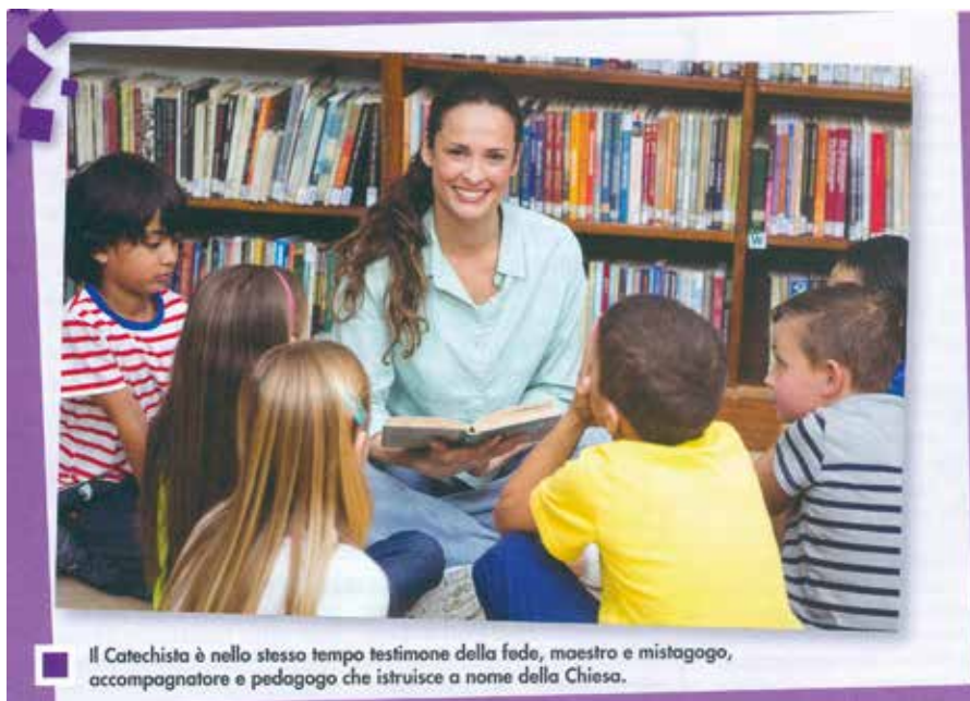
Il Catechista è nello stesso tempo testimone della fede, maestro e mistagogo, accompagnatore e pedagogo che istruisce a nome della Chiesa.

formazione biblica, teologica, pastorale e pedagogica, e aver già maturato una previa esperienza di catechesi» (AM 8).