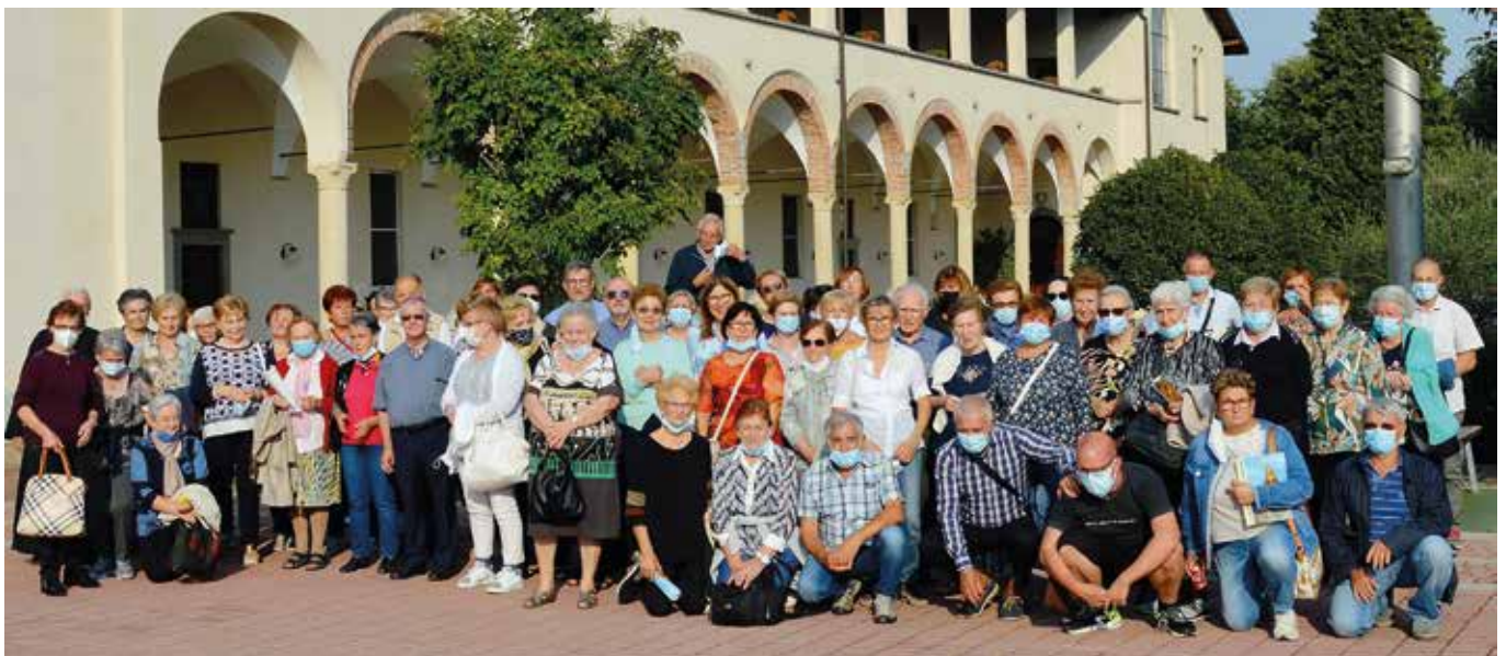
Pellegrinaggio di inizio anno dell'Unità Pastorale al Santuario della Madonna della Basella

Non è difficile trarre uno stimolo per tutti noi in questo tempo di ripresa delle attività pastorali: ad avere stima e cura della celebrazione della Messa domenicale. Non trascuriamola. Una liturgia semplice, bella e autentica ci fa pregare bene, irradia bellezza e attira. È importante perciò che chi presiede curi bene tutta la celebrazione, in particolare l'omelia, è importante la cura del canto, è importante la presenza dei diversi ministri (diaconi, accoliti, lettori, salmisti, cantori...), è fondamentale l'assemblea radunata che fa esperienza, attraverso ciò che si vede, si tocca, si sente, che è ben diverso dall'«assistere» davanti a una tv o a uno schermo. Forse è necessario attivarsi per recuperare coloro che hanno smarrito questo senso del "noi". Una vita comunitaria partecipata, gioiosa, fraterna, anche al di fuori delle celebrazioni, aiuterà molto a manifestare la bellezza dell'essere Chiesa.