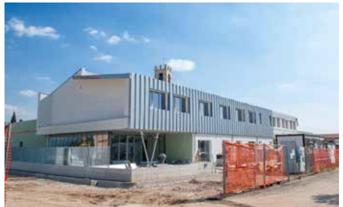
Quasi pronte le nuove scuole per Bornato