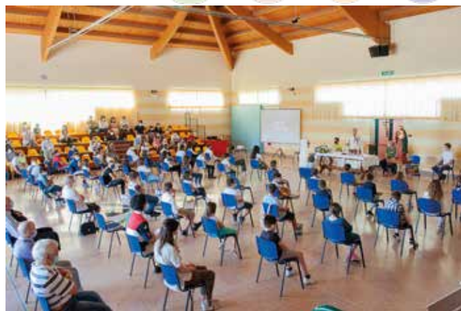
Santa Messa in polivalente per la conclusione dell'ICFR