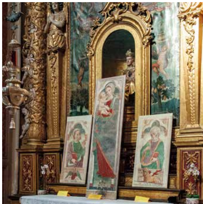
Nella Festa di San Bartolomeo esposizione degli affreschi restaurati