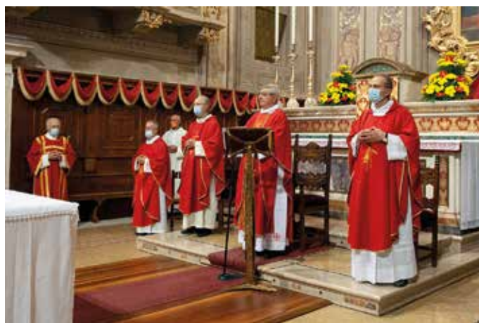
Concelebrazione di San Bartolomeo con don Amerigo