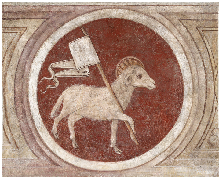
L' Agnus Dei (70x55 cm), che trovava posto al culmine dell'arco tra gli Evangelisti da un lato e dall'altro.