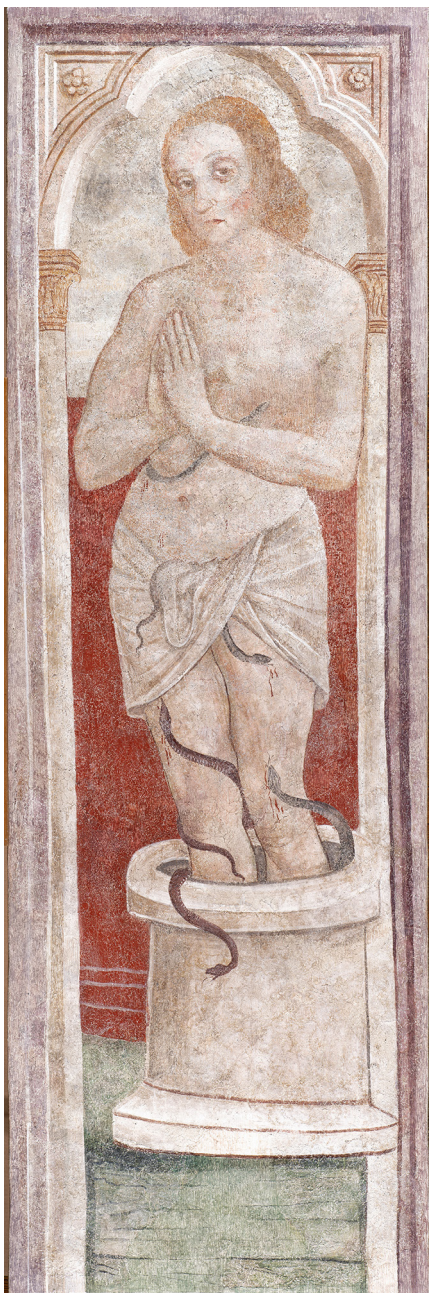
San Giulio (55x175), emergente da un avello di serpi.