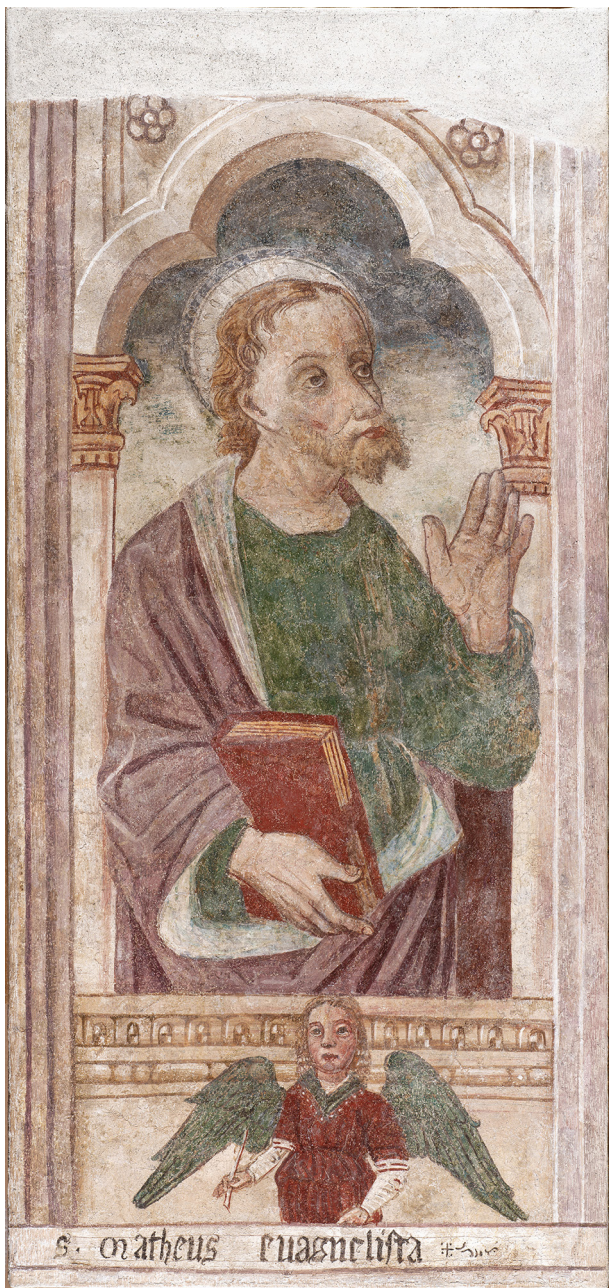
s. matheus euangelista # 500